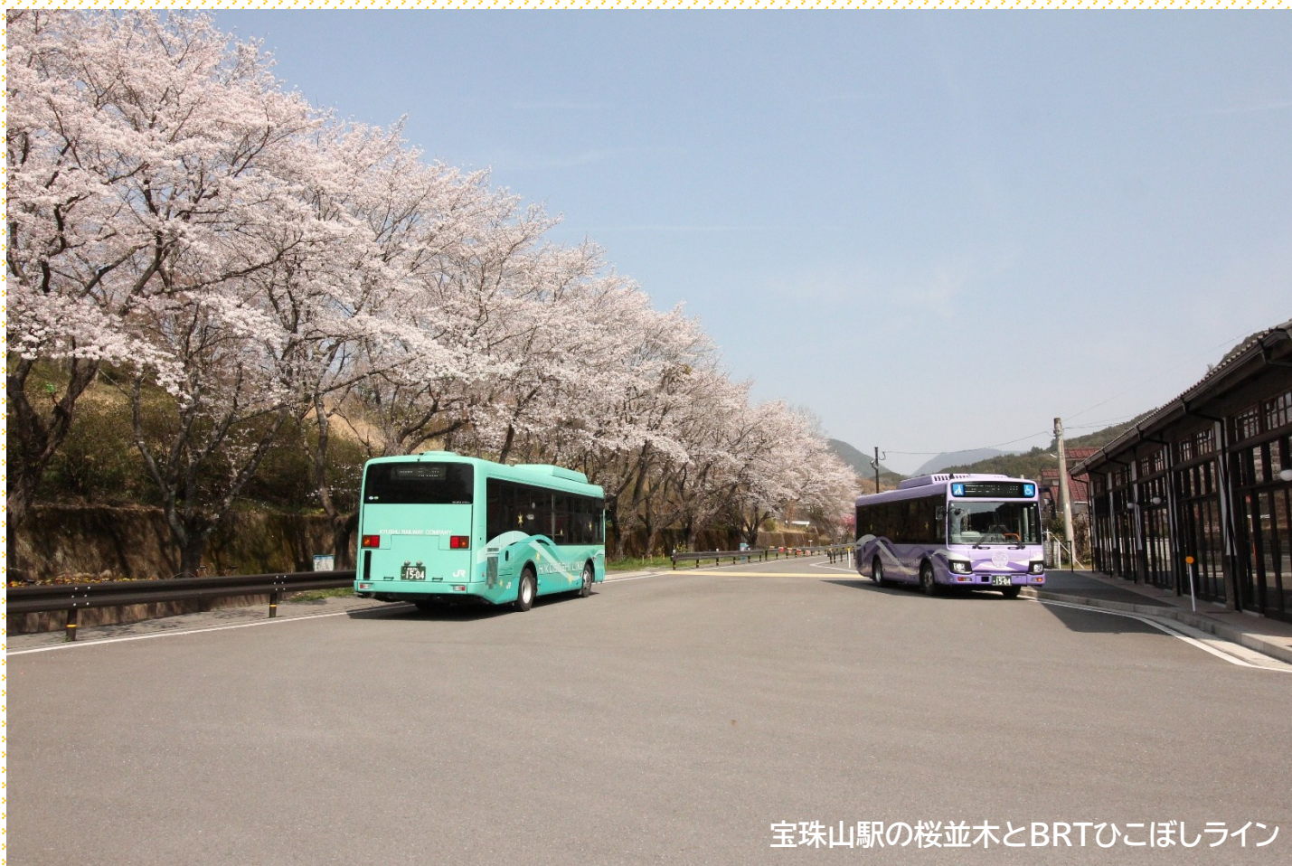
宝珠山駅の桜並木とBRTひこぼしライン

村民の皆さんがご利用いただける補助事業を一覧にしました。 詳しい内容についてはそれぞれの担当課にお尋ねください。