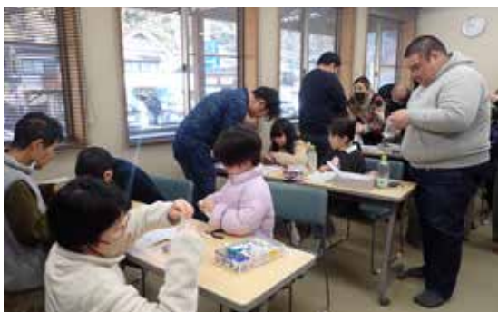
▲説明書を見ながら

1月10日(土)、いずみ館において、ミニ四駆作りを行いました。参加者は児童23名、保護者を含む大人21名でした。子ども達は好きな車種のミニ四駆を選び、大人も一緒にワクワクしながら作り始めました。完成後は2コースに分かれ、自分で作りあげたミニ四駆を走らせました。子ども達は、時間いっぱい最後まで楽しんでいました。