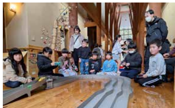
▲みんなで走らせて