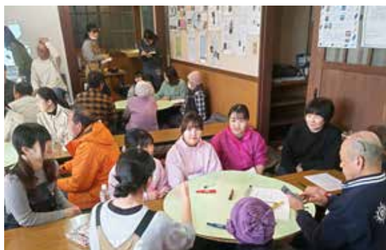
▲大学生と村民が地域振興について話し合いました

会の最後に、今後も大学と村が協力し合い、このような取り組みを継続していくことを確認して閉会しました。