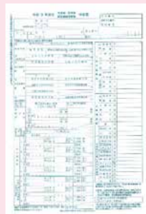
▲提出用の封筒と申告書