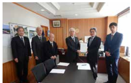
▲朝倉地域道路整備推進協議会様から 要望書を受け取りました

村ではこの要望を踏まえ、引き続き国や県に対して、道路整備の要望を行ってまいります。