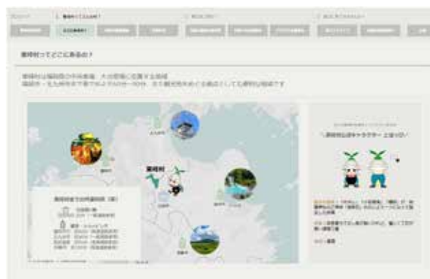
▲村の魅力を伝えることを重視した受賞作品

この取り組みは、令和5年に締結した「ICT連携協定」に基づくもので、今後も村では、DXによる地域課題の解決や、暮らしやすい村づくりを進めていきます。受賞作品は「Open Data Battle2025」のホームページに掲載されていますので、ぜひご覧ください。