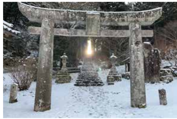
▲岩屋神社の光の道