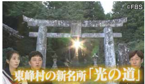
▲岩屋神社の光の道が紹介されました！

テレビ番組内では、東峰村の自然環境や周辺の風景とともに、「岩屋神社の光の道」が生み出す幻想的な景色が紹介されました。放送をきっかけに、今後さらなる来訪者の増加が期待されます。