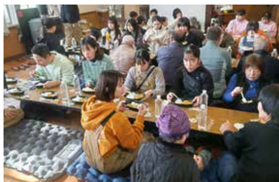
▲昼食で楽しくおしゃべり