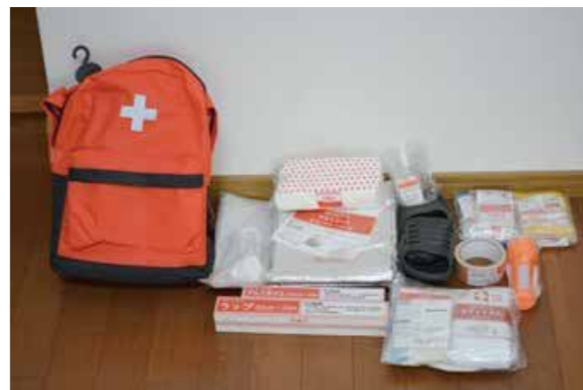
西福井地区の防災セット