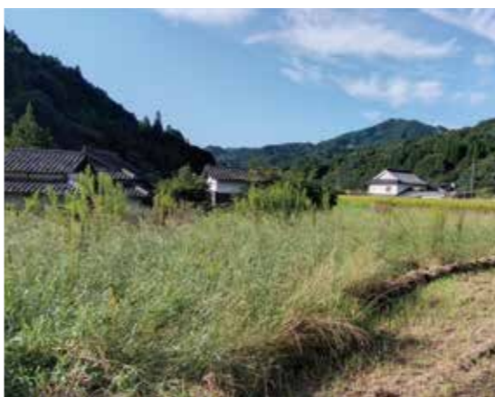
景観にも影響する耕作放棄地

村長 村としては中山間直接支払制度の中で農地保全を行っている。小石原地区については多面的機能支払交付金等を用いて農地保全対策を行っている。そのほか鳥獣害対策を補助や事業で取り組んでいる。