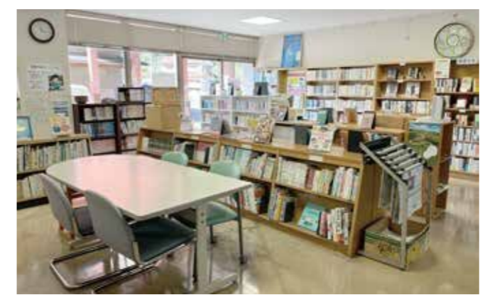
宝珠山公民館の図書スペース

議員 例年図書購入費が55万円になっている。村民が本を多く読むためには予算を増額してもよいのでは。 村長 本の単価も上がっているので、本年度中に整理をして来年度予算で検討したい。 議員 他自治体では予算の1%を図書費にするとところもある。今後の図書行政への考えは。 村長 文化発信等で、もの足りないと思っている。数年中にはしっかりと取り組まないといけない。