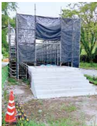
改装中の宝珠山駅ホーム