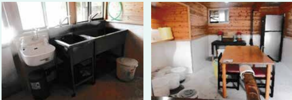
小屋を改修した加工所

歳も歳ですが、補助金が出るので、費用が余りかかりませんでした。梅干し等を店に出す楽しみで思い立ちました。