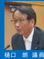
樋口 朗 議員