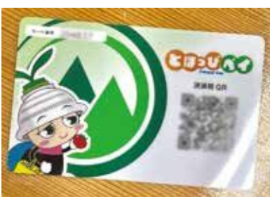
とほっぴペイカード

議員 利用者の「一定の負担」について、高齢者に補助金交付時にわかりやすく説明できないか。 村長 交付時にチラシ等で説明している。制度上できるとすれば負担を求める方法もある。例えば2割負担とすれば、2千円をカードにチャージ(現金補充)すると、1万円分の利用券になる。この場合、制度変更となるので事業者等の理解を得ながらやりたい。