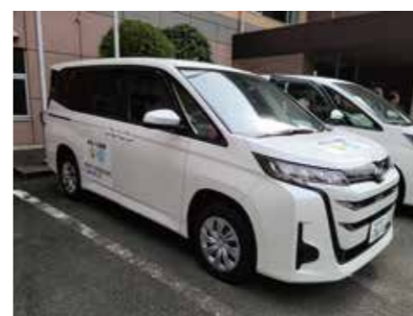
乗合タクシーのりーと

西鉄バス（杷木〜小石原線） 令和6年度末廃止へ 10月よりバス減便、 乗り合いタクシーで 朝夕対応