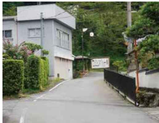
国道からのアクセス路 幅員3m余りは林道より狭い

議員 過去に「大行司駅進入路の改良について」一般質問をした。その時、村長は「現時点での改良の必要性は低い。基本計画策定の中で、実現するための試算や費用対効果を検討する」と答えた。しかし、基本計画には「国道からのアクセス路が狭い」と、課題として記載されている。村長は改良の必要性は低いと考えているのか。 村長 これまでマイクロバス等が行き来した中でも、事故等は起こ