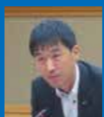
高橋 弘展 議員

村長 団体や法人が取り組みをするときは支援がしやすいが、個人に補助というのは制度の構築など難しい。これからの営農のあり方についてじっくりと考え、一歩を踏み出す必要がある。