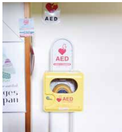
喜楽来館に設置されているAED

村長 午前6時過ぎから陸上の練習をしているので関係者で協議したい。村内で各種大会等を行うときは、主催団体が持つてきていると聞いているが、考えたい。