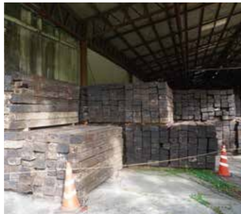
村が所有する大量の枕木

議員 JR九州より受領した2765本の枕木が、東峰村の所有となっている。昨年のBRT駅周辺整備基本構想、今年の基本計画には、三駅で枕木を利用する計画はない。今後どのように利用するのか。 村長 宝珠山駅の公園部分と筑前岩屋駅の整備で全量使ってしまうように、計画している。