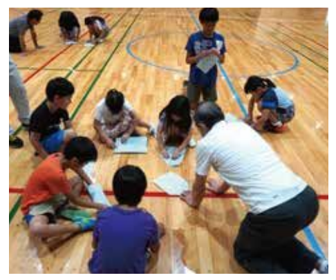
東峰Jr.みらい塾の紙ひこうき作り