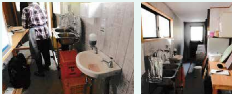
自宅横の通路を改修した加工所

狭い土地しかありませんでしたが、保健所の許可がありました。補助金で、自分の出し分が少なくて済みました。