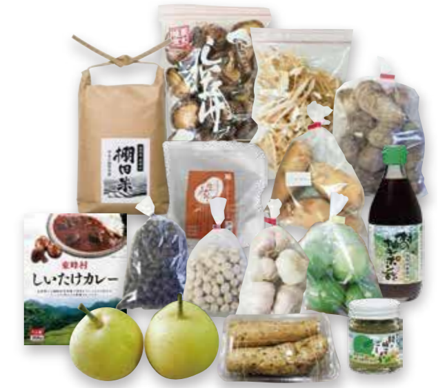
宝珠山ふるさと便の商品

議員 宝珠山ふるさと便は多い時で100名以上の会員数があった。近年の会員数の推移と今後の方向性は。 担当課 令和5年度は22名で、近年少ない時で13名だった。現在運営委員会と役場と一緒に広報活動を行っている。チラシの配布も委員会と足並みを揃えていきたい。