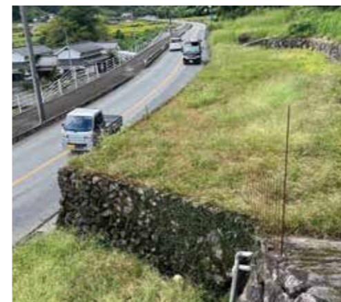
国道沿いの休耕地

議員 元気なシルバー世代の方たちをライスセンターに登録して、耕作面積を増やしていく、そういった方法は考えられないか。 村長 可能性としては非常に高い。これをどのような形で仕組みを作っていくか、重要な宿題と思う。