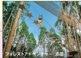
フォレストアドベンチャー・添田