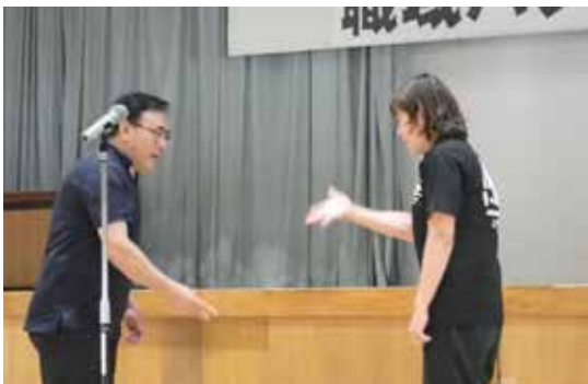
▲決勝戦（じゃんけん）の様子 JA 筑前あさくらチーム対東峰村役場Bチーム