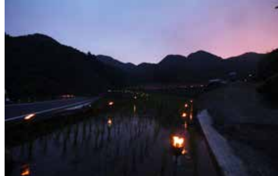
▲トーチの灯りに映しだされた棚田