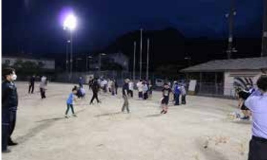
▲モルック大会の様子

5月25日（木）、宝珠山グラウンドにて春季モルック大会を開催しました。当日は小学生から大人まで35名、12チームの方にご参加いただきました。どのチームも戦略を練りながらプレーし、ナイスプレーが飛び出すと歓声があがっていました。優勝は「キンコース」チームで昨年度大会から2連覇となりました。今年度は8月、11月、2月にもモルック大会を開催予定ですので、皆様のご参加をお待ちしています。