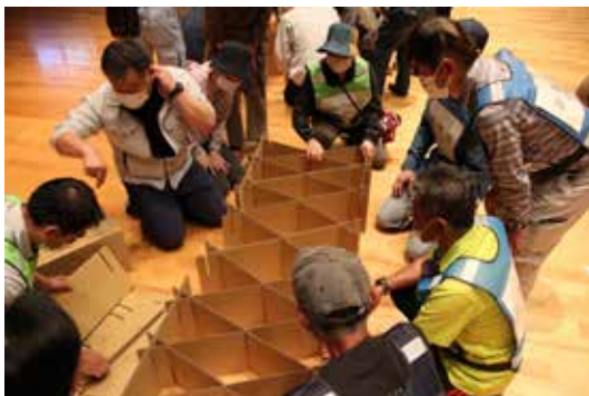
▲いずみ館での訓練の様子

東峰村は2つの会場で訓練を行い、いずみ館では大行司地区の方を中心に避難者の受付や負傷者の発生を想定した避難場所設置運営訓練、東峰学園グラウンドでは北九州消防局のヘリによる孤立者救出搬送訓練が行われました。