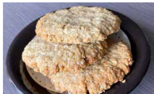
▲オートミールのクッキー