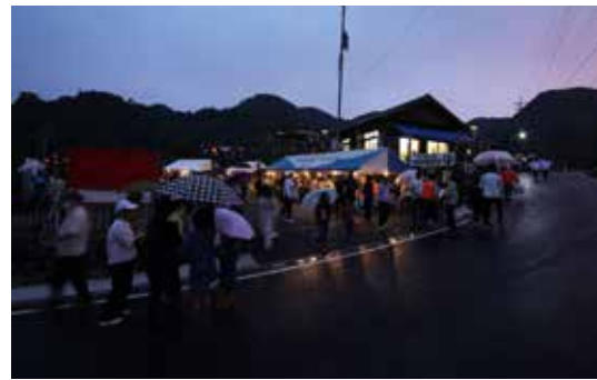
▲来場者で賑わう会場