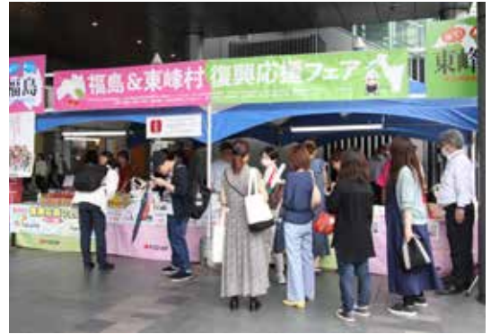
▲お客様で賑わう JR 博多駅前広場

今回のイベントは、災害復興応援活動の一環として地域の魅力をPRする目的で企画され、株式会社JR博多シティ様とエフコープ生活共同組合様からのご提案で昨年からの開催しています。店頭には、福島県のサクランボや東峰村の「小さな宝」認定品の柚子胡椒など、自慢の特産品が並び、大盛況でした。