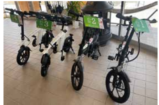
▲アクアクレタ小石原に導入された レンタサイクル

今回のレンタサイクル導入により、アクアクレタ小石原を拠点とした、道の駅や小石原焼伝統産業会館、窯元巡りなど、小石原地域での観光周遊の促進が期待されます。ご予約は、アクアクレタ小石原のホームページをご確認ください。