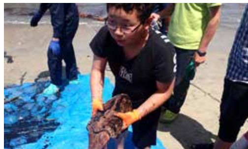
▲イカが大量でした