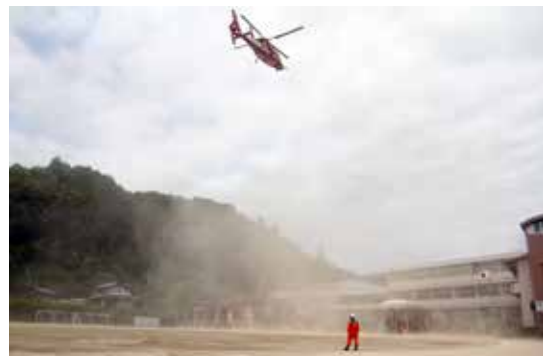
▲東峰学園グラウンドでの訓練の様子