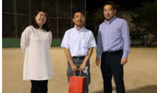
▲優勝した「キンコース」チーム