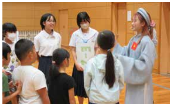
▲レクリエーションの様子