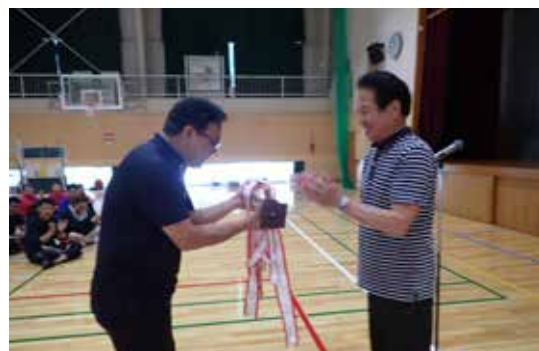
▲優勝はJA 筑前あさくらチーム （令和元年度に引き続き2連覇）