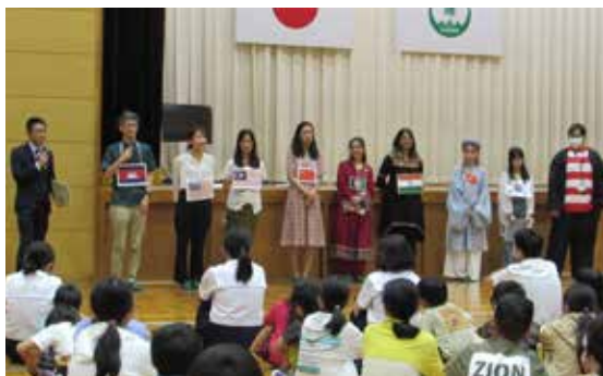
▲民族衣装で自己紹介をする APU 学生

将来の生き方や職業選択について、国際的視野で夢を持つ学生とのふれあいを通して、自分を見つける機会になることが期待されます。