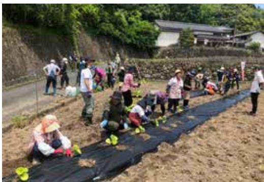
▲かぼちゃの苗植えの様子

参加した方々は「復興、交流のしるしとして今後も大切に育てていきたい」とおっしゃっていました。