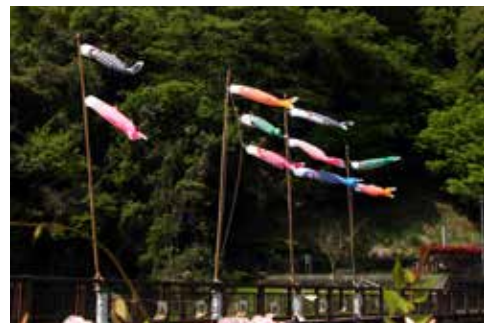
▲いずみ館裏の鯉のぼり

元気に泳ぐ鯉のぼりのように、子ども達も仲良く、元気に成長してほしいという願いが込められています。