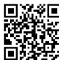
▲東峰村応援団登録申請フォーム