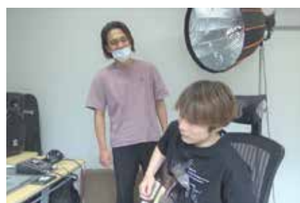
▲東峰テレビの番組内で使用するBGMを作曲