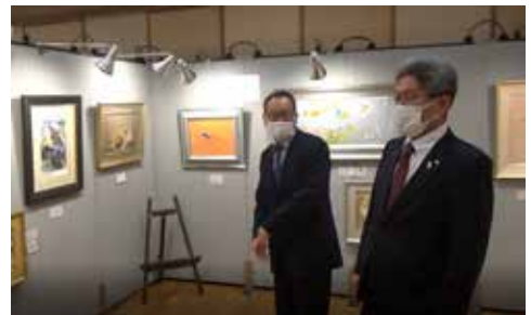
▲作品を鑑賞する村長

この展示会は九州北部豪雨災害復興支援のためのチャリティーとして企画されたもので、訪れた方々は、日頃なかなか見ることができない個性豊かな有名画家の作品を楽しまれていました。