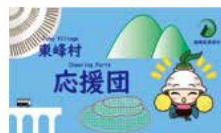
▲東峰村応援団の団員証