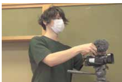
▲色んなイベントで撮影をしました