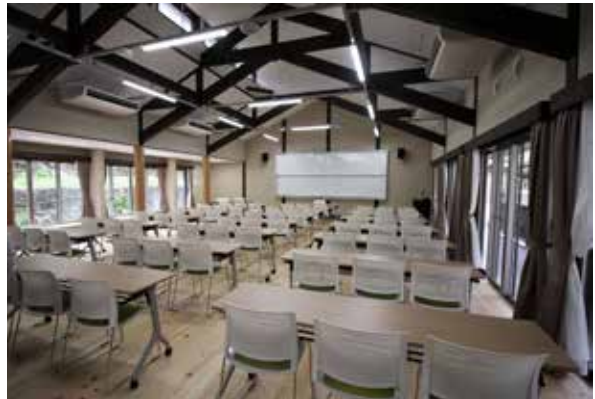
▲防災・地域コミュニティの拠点としても活用できる広い多目的室