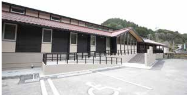
▲完成した新ほうしゅ楽舎

これまでの農村ツーリズムの拠点としての機能に加え、新たに防災及び地域コミュニティの拠点としての機能も併せ持った施設として運営していく予定です。正式なオープンは夏頃を予定しており、詳細が決まり次第、お知らせします。