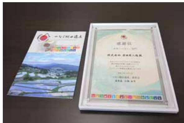
▲「つなぐ柵田遺産」感謝状

*『東峰ニュース&トピックス』では、村民の皆様からの村内での出来事等の情報を募集しています。 詳しくは、東峰村役場ふるさと推進課（0946-72-2312）までお問合せください。