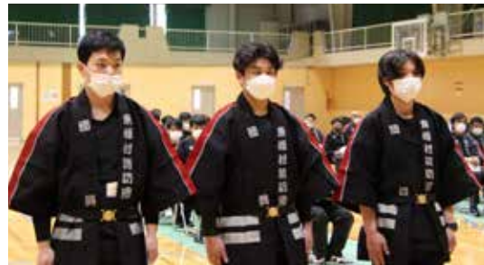
▲新入団員のみなさん (当日出席の3名)