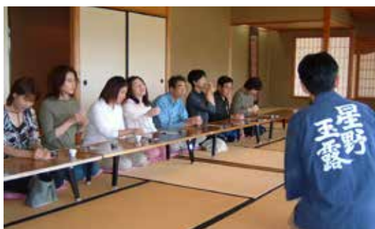
▲新茶まつりお茶当てクイズ