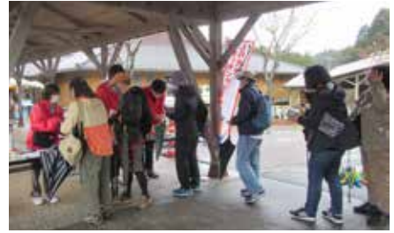
▲雨にも関わらず、たくさんの方々が参加

3月21日（祝・火）、小石原地区にて、春の日田彦山線沿線7自治体合同イベント「ひたひこウォーキング」と「JR九州ウォーキング」が合同で開催されました。当日はあいにくの雨でしたが、県内を中心に112名の参加がありました。参加した方々は、窯元や道の駅、小石原焼伝統産業会館などを巡り、村の春をゆっくりと楽しんでいました。