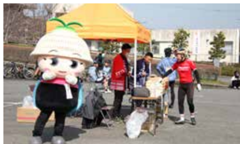
▲役場小石原庁舎前ではとほっぴがお出迎え

*『東峰ニュース&トピックス』では、村民の皆様からの村内での出来事等の情報を募集しています。詳しくは、東峰村役場ふるさと推進課（0946-72-2312）までお問合せください。