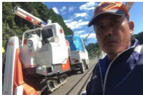
▲コンバインの操作にもだいぶ慣れました