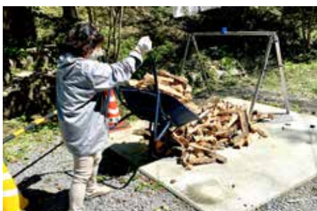
▲キャンプ場では薪割りも重要な仕事