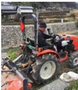
▲トラクターで田を耕す