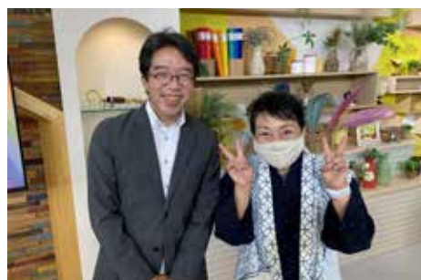
▲東峰村のPRでテレビにも出演