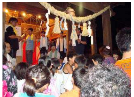
▲恒例のうそ替え、参加者も大興奮

このページの詳細は「東峰村そんみん塾」のホームページに掲載されています。 是非、ご覧ください。 http://www.sonminjuk.com