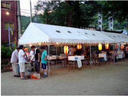
▲地元の人たちによる出店

宝珠山の高木神社では、毎年7月終わりの日曜日に夏祭りが行われます。今年は7月27日（日）に行われ地元の人たちが出店を出し、多くの参加者の下、人形芝居・和太鼓演奏・子供和太鼓・高木神社神楽・恒例のうそ替で賑わいました。