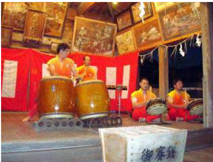
▲和太鼓の競演で盛り上がりました