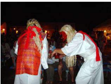
▲神楽舞のふたりが観客の中で振る舞い酒