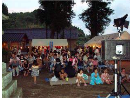
▲たくさん参加がありました