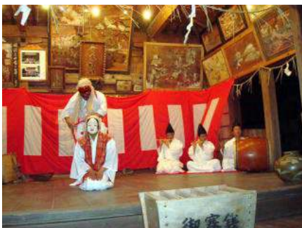
▲高木神社神楽の一場面です