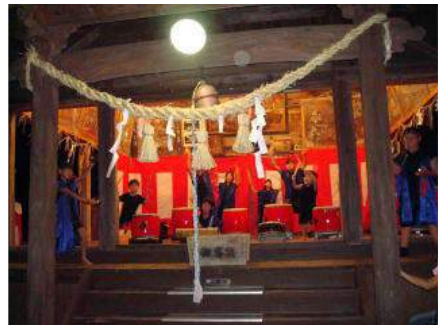
▲子供太鼓（わらべ座）宝珠山小の子供達です