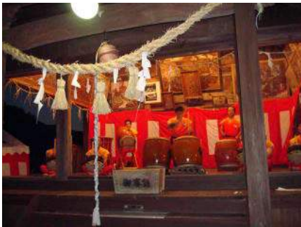
▲小石原の伝統太鼓 和太鼓修験童