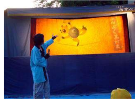
▲ぶんぶく茶がまの人形芝居