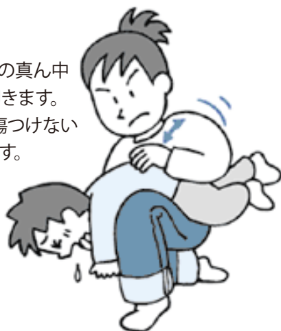
おなかを圧迫して、詰まっているものを吐き出させる

頭を低くして、背中の中を平手で4、5回叩きます。なお、腹部臓器を傷つけないように力を加減します。