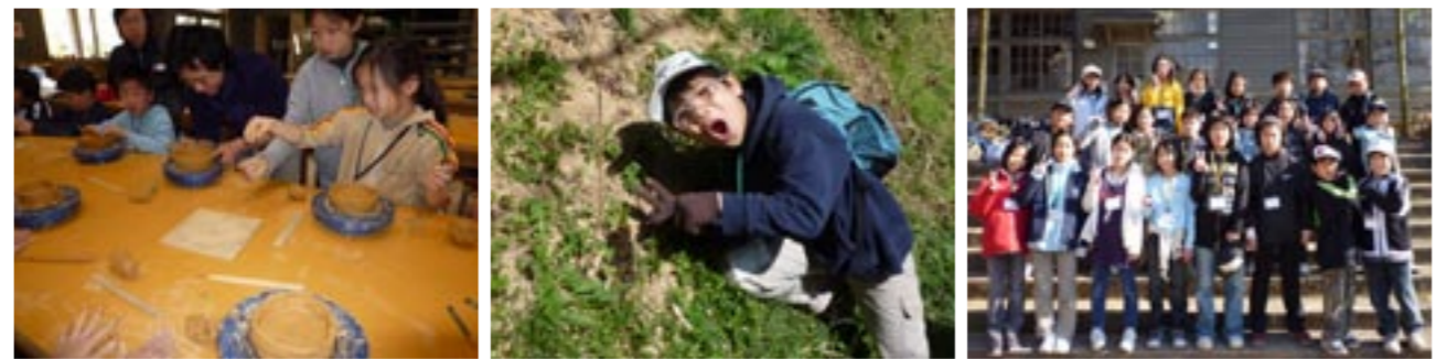
▲初めての子もいた陶芸体験 ▲小さなタケノコ発見♪ ▲みんな大満足の1泊2日でした!