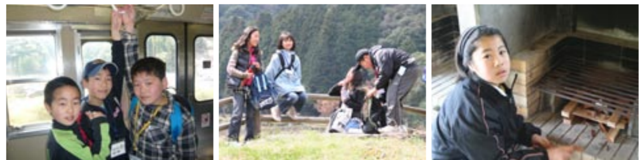
▲ JR を使って、岩屋駅へ ▲ウォークラリーでカレーの食材をゲット! ▲役割分担で夕食作成!「私は火起し担当」