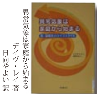
異常気象は家庭から始まる デイヴ・レイ 著 日向やよい 訳