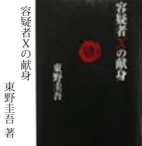
容疑者Xの献身 東野圭吾 著