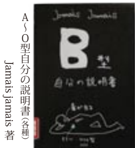
A〜O型自分の説明書各種 Jamais Jamais 著