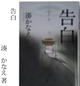
告白 湊かなえ 著