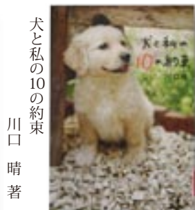
犬と私の10の約束 川口晴 著