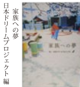
家族への夢 日本ドリームプロジェクト 編