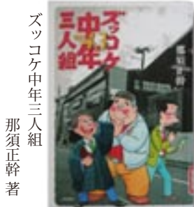
ゼロから三人組 那須正幹 著