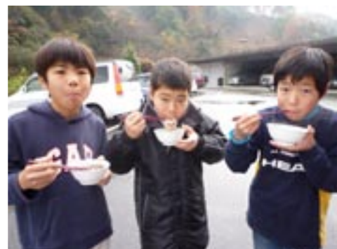
▲自分たちでついたおもちは美味し〜い♪