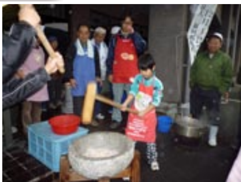
▲きねは重たかったけれど、頑張りました！

もちつきという伝統行事を通じて、幅広い世代での交流ができ、子ども達にとっても良い機会になったことと思います。