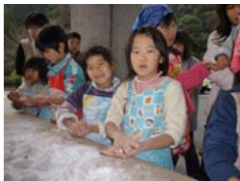
▲ほっぺにおしろいが付いてるよ(笑)