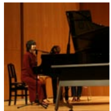
▲参加者の皆さんも一緒に歌い、心地良い一体感が生まれました。

講演の中では、「最初はあれができない、これができないと悲観していましたが、周囲の方々の優しさに触れ、私にできることで恩返しをしたいと思うようになりました。」と、日常に溢れる幸せに目を向けることの大切さを教えてくださいました。また、講演の後半には耳で聴いて暗譜されたという素晴らしいピアノ演奏や、美しい歌声をご披露いただいたり、参加者と一緒に歌ったり…会場全体に一体感が生まれた、心に響く講演でした。