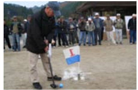
▲多くのギャラリーに緊張の一打…