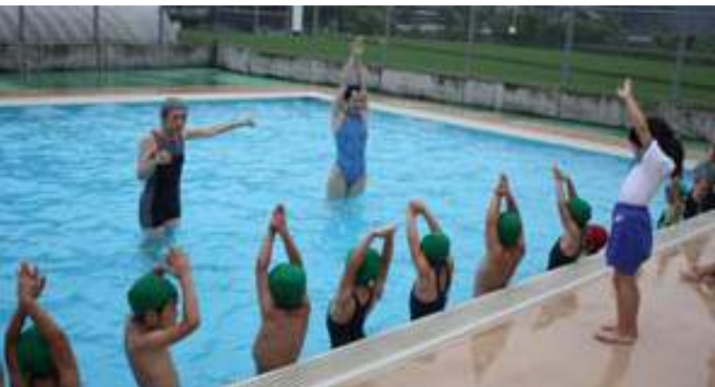
▲みんな熱心に指導を受けました。▲