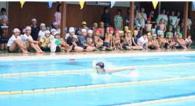
▲みんな世界レベルの泳ぎに見入っていました。