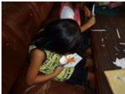
▲ペーパークラフト作り

右の作品2点は10月に行われる予定でありました「こども文化祭」に展示するため一生懸命、作製に取り組んできましたが中止となりましたので写真でご紹介させていただきます。