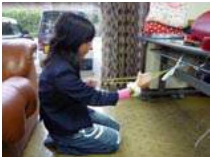
▲古代織ストラップ作り