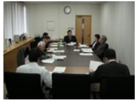
▲外部評価委員会の様子です

12月14日(月)、東峰村役場宝珠山庁舎第2会議室において、東峰村外部評価委員会を開催しました。東峰村の行政評価システムは、担当者・担当課で行う一次評価、各課長級の会議で行う二次評価を経て、三次評価にあたる外部評価委員会というように順次執り行ってきました。この外部評価委員会は、現在マスコミでも話題の事業仕分けの手法を取り入れたものであります。