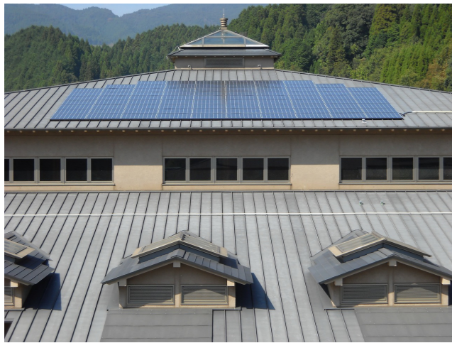
▲いづみ館の屋根に設置された太陽光パネル

九州グリーン電力基金は、環境意識の高いお客様と電力会社が協力してつくられたもので、集まった拠出金により、太陽光や風力など環境に優しい自然エネルギーの施設整備などに助成が行われています。九州電力もお客様から集まった拠出金と同額程度を同基金に寄付したり、申込み受付を代行するなどの積極的な支援がされており、平成21年11月末現在で、加入件数5,597件、加入口数6,900口（1口500円/月）となっています。