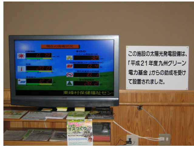
▲館内に設置されたモニターでは、発電の状況やCO2（二酸化炭素）の削減量を見ることができます