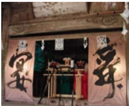
▲神楽舞の舞台を飾った迫力のある「書」

今年は、県立太宰府高校芸術科のデザイン、企画による「モニュメント」作品などが一段と祭を盛り上げました。