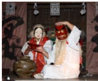
▲小石原神楽「陶の舞」