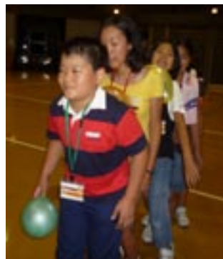
▲レクリエーションの様子