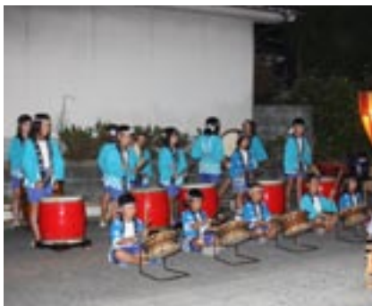
▲小石原やまびこ太鼓による演奏