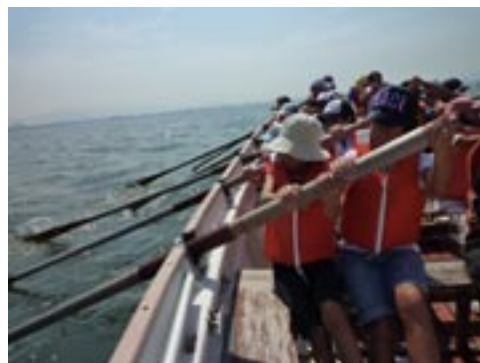
▲みんなで力を合わせたカッター教室