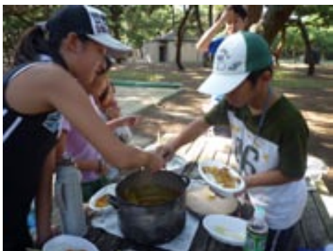
▲キャンプと言えば、カレーで決まり♪