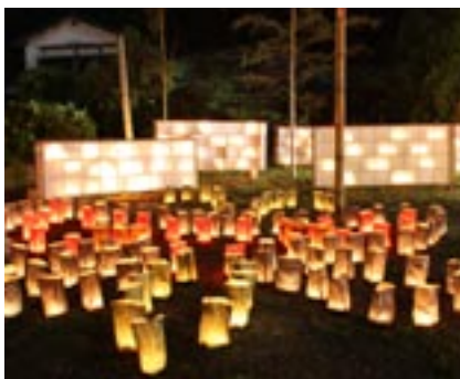
▲幻想的なともしび