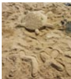
▲砂の造形コンテスト