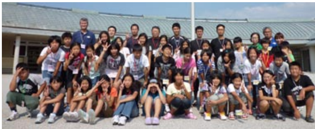
▲全員での記念撮影