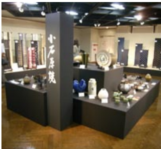
▲小石原焼の展示コーナー