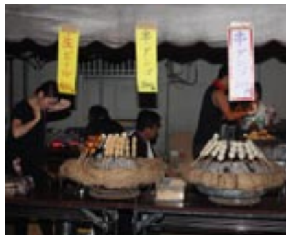
▲おいしそうな串だんご等の夜店