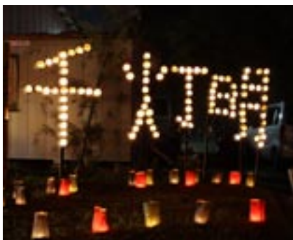
▲千灯明の文字が映えました