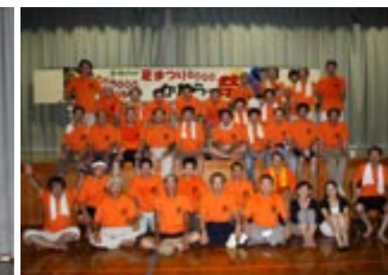
▲実行委員会のみなさん、お疲れ様でした