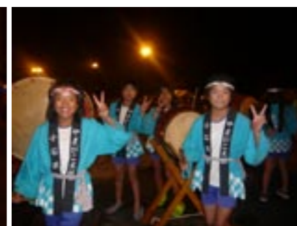
▲やまびこ太鼓のみなさん