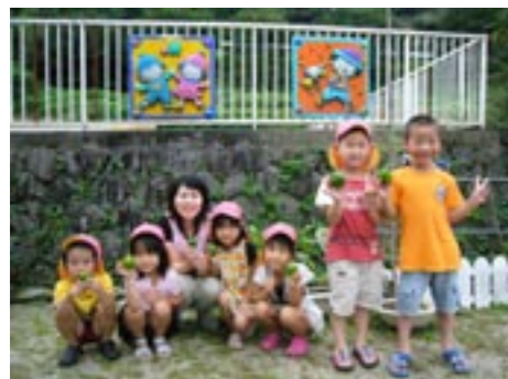
▲おいそなピーマンがとれました!!