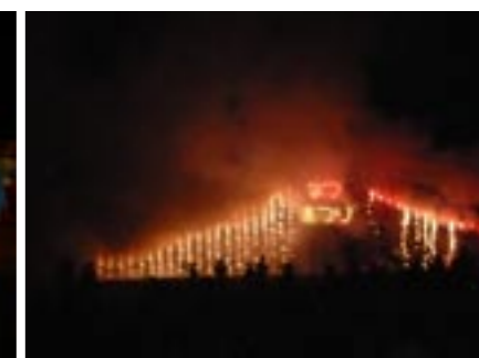
▲きれいな花火に歓声が沸きました

村民の皆様からもレポートを募集しています。ニュースやトピックス等、記事がありましたらご連絡ください。また、有料広告の募集も行っておりますので、ご利用いただけますようよろしくお願いいたします。詳細につきましては下記まで。