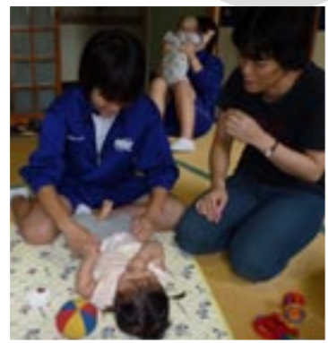
▲初めてのオムツ交換にも挑戦!

8月3日(月)、宝珠山公民館において東峰中3年生の4名が託児体験をしました。お母さん達が別室で学習している間、4ヶ月~2歳までの乳幼児7名を預かりお世話をしました。