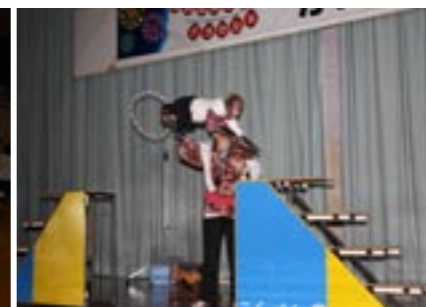
▲ステージイベントも盛り上がりしました