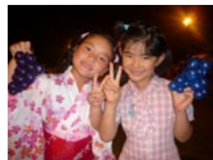
▲バルーンもらったよ!

一方、会場内ではバルーンの実演もあり、できた作品をもらった子どもたちも大喜びでした。