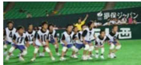
▲気合十分の選手たち!

8月2日(日)福岡ヤフージャパンドームで福岡県小学生ドッジボール交流大会がありました。村からは20名の小学生が5日間の特訓を受け大会に挑みました。