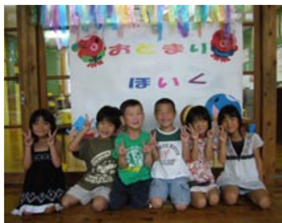
▲全員集合!!今からお泊り保育が始まるよ

一日だけのお泊りでしたが、みんながなんだか、お兄さん、お姉さんになったような気がしました。