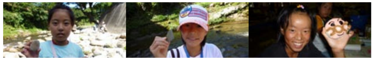
▲一人ひとり河原で探したおもしろい形の石たち……最終的には…… ↑こんな見事な作品に仕上がりました♪