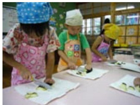
▲上手に切れてますよ