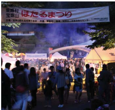
▲大勢の来場者で賑わいました

また、同日、JR九州主催の「ナイトホタルウォーキング」が開催されました。617名の参加者が、宝珠山駅から筑前岩屋駅までの約8kmのコースを、初夏の心地よい風を浴びながら歩いていました。