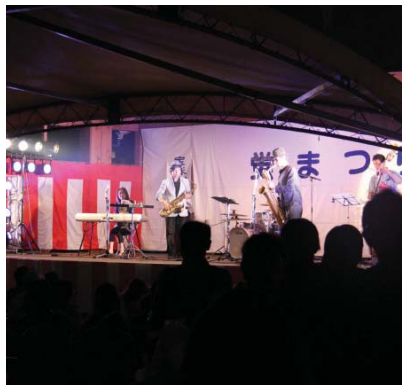
▲ステージイベントも盛り上がりました