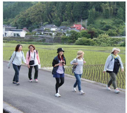
▲自然を感じながらのウォーキング