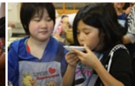
▲どんな味に仕上がったかな～♪