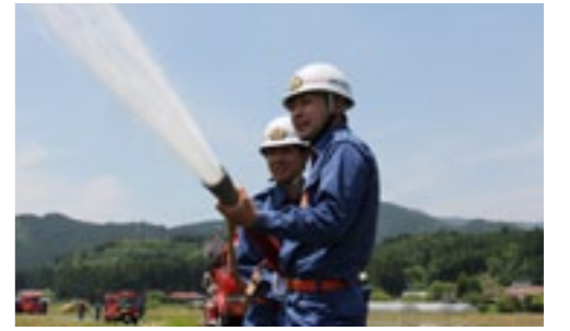
▲放水を行う機関科の団員