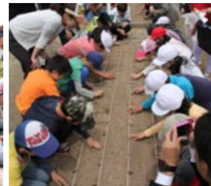
▲大きなひまわりが育ちますように