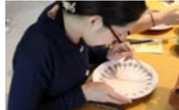
▲絵付け体験の様子