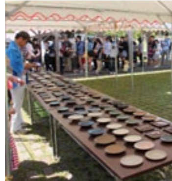
▲行列ができた小皿販売

5月3日(日)～5日(火・祝)の3日間、春の民陶むら祭が行われました。初日の天気は雨でしたが、4日と5日には天候も回復し、多くの観光客で賑わいを見せていました。小石原焼伝統産業会館では、七寸皿の絵付け体験と小皿付きおにぎりの販売が行われました。