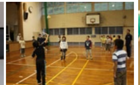
▲スポーツ交流大会