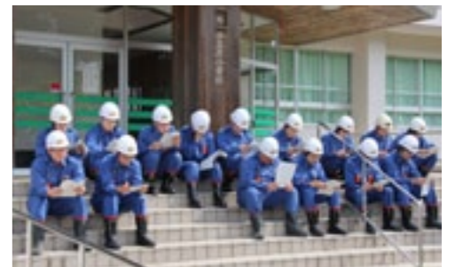
▲講習を受ける初任科の団員

5月17日(日)、旧小石原小学校において消防協会朝倉支部教養訓練が行われました。当日は、甘木・朝倉消防署東出張所の署員による指導で、入団から3年までの団員を対象に初任科訓練が、入団4年目以降の団員を対象に機関科訓練が行われました。新入団員は初めての訓練で、戸惑いながらも何度も練習を繰り返しながら、訓練礼式やホースの搬送や延長、結合等を学んでいました。また、機関科訓練では、訓練礼式をはじめ、中継訓練等を行いました。