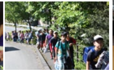
▲喜楽来館に帰ってくる子どもたち