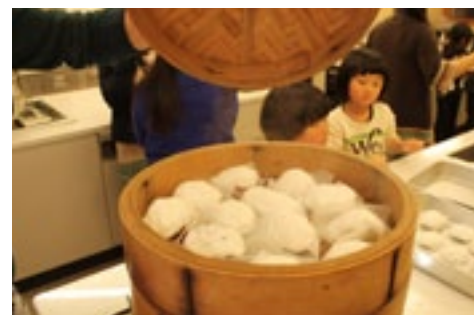
▲ほっかほかのお団子ができました