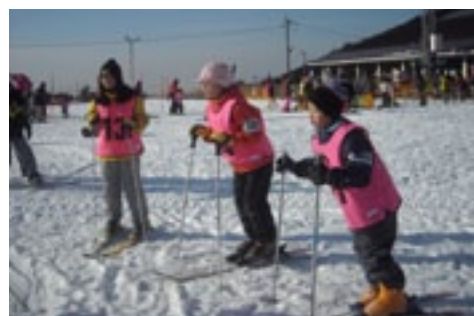
▲わくわく、どきどき