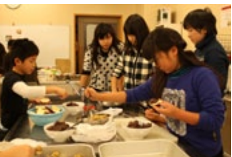
▲お団子作りも真剣です