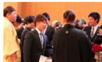
▲式典終了後は久しぶりに合う同級生と記念撮影、話もはずみます