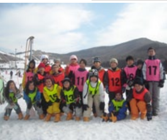
▲楽しかった！満面の笑みで記念撮影♪

1月25日(日)東峰 Jr. みらい塾は大分県九重町の九重森林公園にてスキー教室を行いました。児童20名と保護者含む大人13名の参加で、午前中は2時間のスキースクール、滑れるようになった午後は自由に広いスキー場を満喫しました。