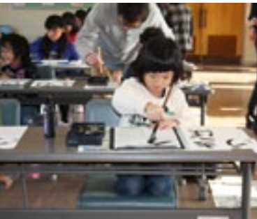
▲お手本に習って真剣に書きました

1月10日(土)東峰 Jr. みらい塾は書初め大会を行いました。児童17名と保護者含む大人14名の参加でした。皆お手本に習い、元気な作品を仕上げる事が出来ましたが、なかでも優秀作品を書いた3名には表彰を行いました。その後、参加者で団子作りも行い楽しく美味しく頂きました。