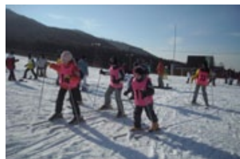
▲すぐに慣れて楽しく滑りました