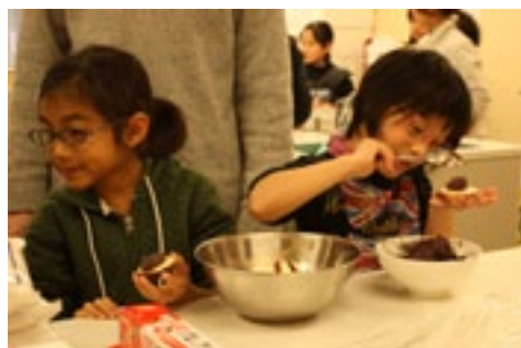
▲上手にあんこをのせて