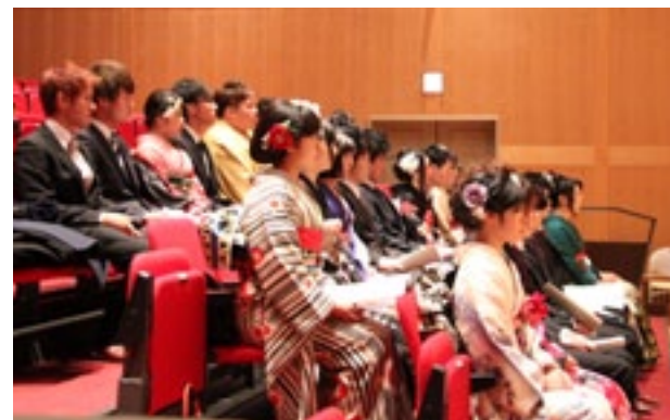
▲厳粛で素晴らしい成人式でした

東峰村の成人式は、福岡県下では最も早く行われるということもあり、多くの報道陣も詰めかけました。