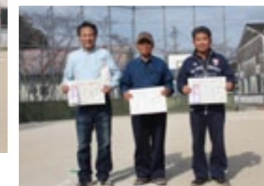
▲ 最少ストローク賞