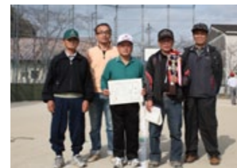
▲ 団体の部優勝 鼓北Aチーム

グラウンドゴルフは、子どもから高齢者まで、幅広く取り組むことができる競技です。東峰村公民館では、グラウンドゴルフの用具の貸出(無料)を行っています。自治公民館活動等の地域活動に、ぜひご活用いただき、元気で活力ある地域生活をみんなで創造していきましょう。