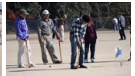
▲ ホール手前は慎重に