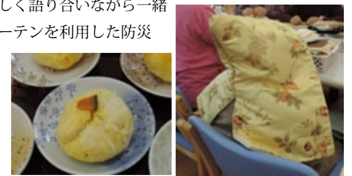
▲ おいしそうな蒸し饅頭

とても素敵な仕上がりで、「備えあれば患いなし」とは言ったものの、利用することがないことを祈りたいものです。