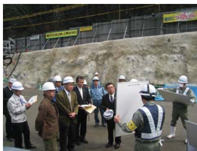
▲ 水浦水路トンネル視察