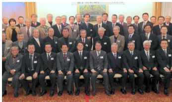
▲朝倉地区交通安全協会、朝倉防犯協会のみなさんと

12日(水)、甘木・朝倉・三井環境施設組合協議会(廃棄物再生処理センター・サポート)