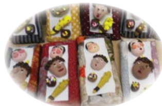
あじわい学級 学級生の作品 "鬼は〜そと、福は〜うち"