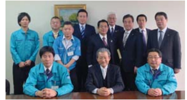
▲東京市場の人たちと