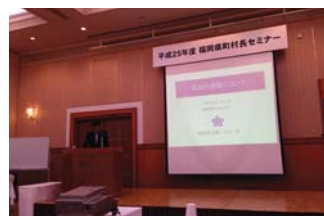
▲町村長セミナー知事挨拶

20日(月)は、県議会議員、市町村長、市町村議長との、「朝倉防犯協会・朝倉地区交通安全協会」合同の新年会。