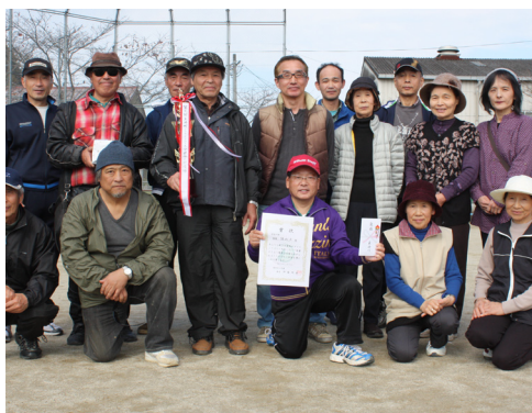
▲団体戦の部優勝の鼓北Aチーム