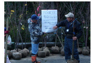
▲ 実行委員による 植樹方法の説明