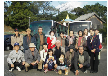
▲ 名護屋城の駐車場で。 はいチーズ♪