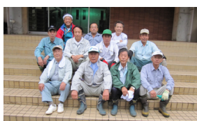
▲ 旧宝珠山小学校歴代 PTA会長の皆さん

「旧小石原小学校緑化委員会」の皆さんが5月～11月にかけて4回、「旧宝珠山小学校歴代PTA会長会」の皆さんが11月2日(土)に、各旧小学校の校舎周りや校庭の草刈り、木々の剪定を行っていただきました。多くの関係者の皆様ありがとうございました。