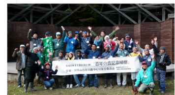
▲ みんなで記念撮影