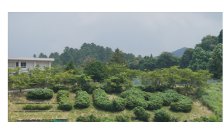
▲ こいしわらの文字が 浮き出てきました