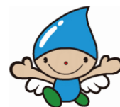
キャラクター 「ちっこりん」