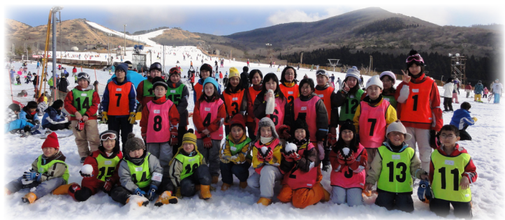
▲みんなで記念撮影～♪ 午後は天気も良くなり楽しく滑れました！