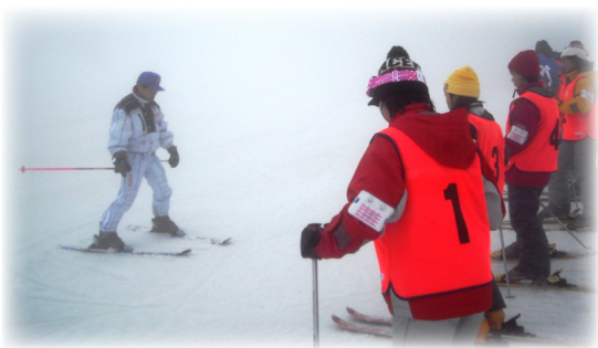
▲午前中はレッスンを受けてました！

2月2日(土)に九重森林公園スキー場へ行きました。2月初めとは思えないほどの暖かさで、路面の凍結もなく無事にスキー場へ到着しました。初めての体験で緊張も見られましたが、楽しみにしていた児童が多かったようです。午前中は、スキースクールで正しい滑り方を教えてもらい、食事のあとは自由にスキーを楽しみました。午前中は、濃霧で視界が悪かったゲレンデも午後は青空の見える絶好のコンディションとなり、滑り慣れた児童は中級者、上級者コースへとチャレンジしていました。3時には終了と短い時間でしたが、女の子は最後まで雪合戦で盛り上がり、事故もなく楽しい一日となりました。東峰村も雪は降りますが、スキー場ならではの貴重な体験ができました。子どもたちには、このような体験を活かして色々なことにチャレンジしてほしいと思います。