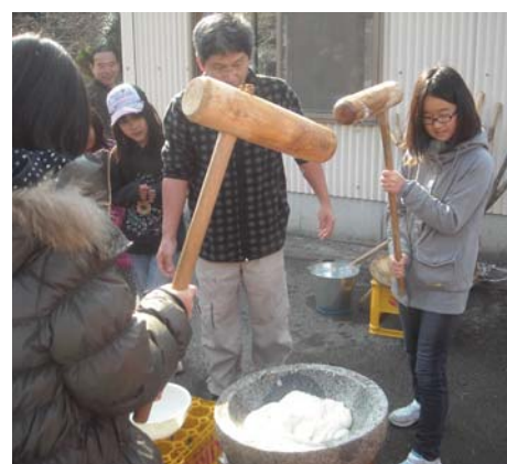
▲餅つきで体もあつたまるね！