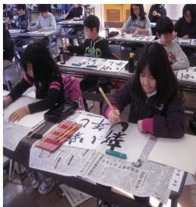
▲みんなとても真剣です