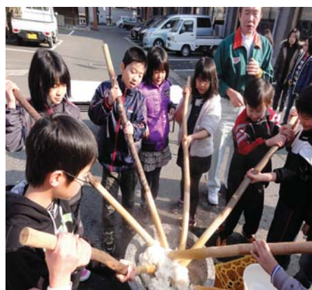
▲みんなでワイワイ棒つき