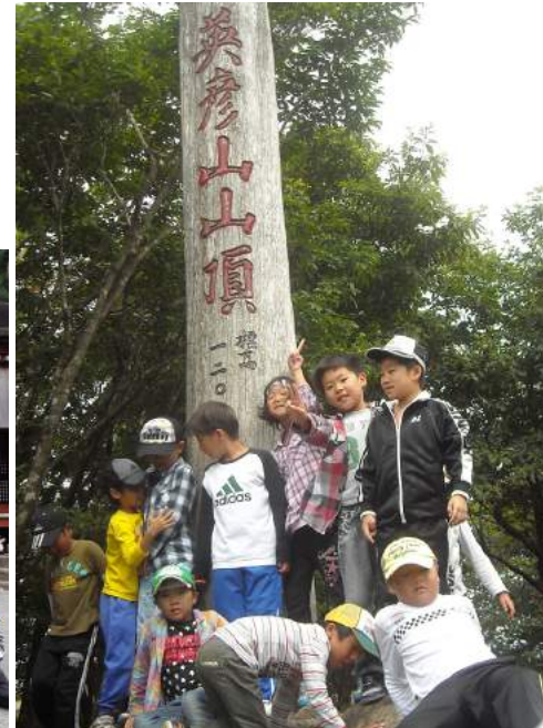
▲標高 1,200 mの英彦山頂にて

8月4日(日)東峰 Jr.みらい塾として初めての英彦山登山を行いました。当日は台風が近づいていたため、風が心地良く絶好の登山日和となりました。低学年も含め22名の児童が参加し、保護者・社会教育委員・事務局を合わせた12名で、登山での心得と注意点を確認して高住神社から英彦山上宮を目指しました。風の影響で望雲台へ行けなかったのは残念でしたが、急な坂道の中には、鎖を伝って登る大変な所もありました。「後何分?」、「後どれくらい?」の声が子どもたちから聞こえて来た頃、無事に北岳を通過して中岳上宮に到着しました。お昼は山頂付近で弁当を食べた後、ゆっくりと奉幣殿へ降りて行きました。汗だくになりながらの登山でしたが、全員が無事下山できました。保護者と委員の皆様ありがとうございました。おいしい山の空気、素晴らしい景色、達成感は山登りの魅力です。