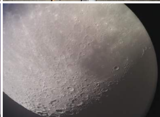
▲大口径の望遠鏡で観測