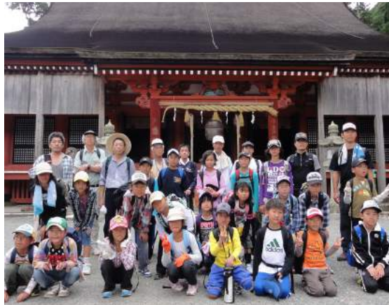
▲英彦山神宮奉幣殿の前で記念撮影