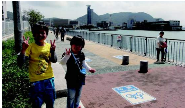
▲門司港をバックに「はい、チーズ♪」