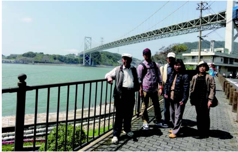
関門大橋を望みながらのハイキング

お昼からは、門司港から下関唐戸市場付近まで、関門トンネル人道で海底を渡り、福岡県と山口県の県境をまたぎ、唐戸市場では新鮮な魚を食べることもできました。