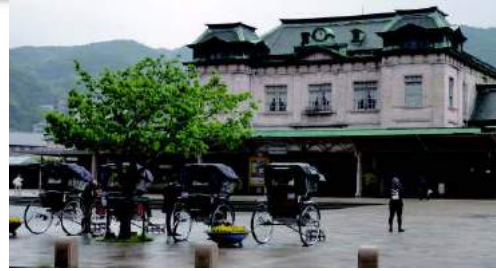
▲JR門司港駅前 レトロな佇まい

東峰村公民館主催による「わくわくバスハイク」を4月22日（日）に開催しました。目的地は、北九州市門司港レトロと山口県下関市の唐戸市場で、子どもからお年寄りまで大型バス2台、総勢76名の皆さんに参加いただきました。