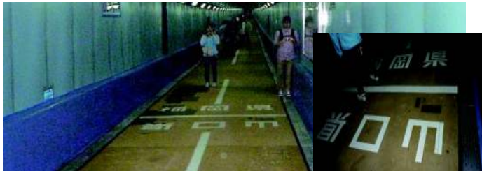
▲関門トンネル人道内 福岡県と山口県の県境

関門海峡を望む雄大な景色を満喫しながらウォーキングすることで、たくさんの歴史や文化を学び、気持ちよい汗をかきました。