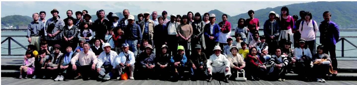
▲関門海峡を背に参加者全員で記念撮影 天気も良くなり海風も心地良かったです