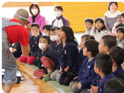
▲先生の読み聞かせを笑顔で聞く子どもたち。