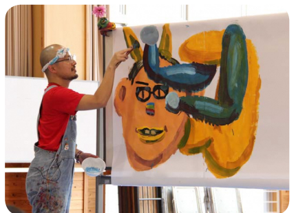
▲子どもたちが描いた絵を仕上げます