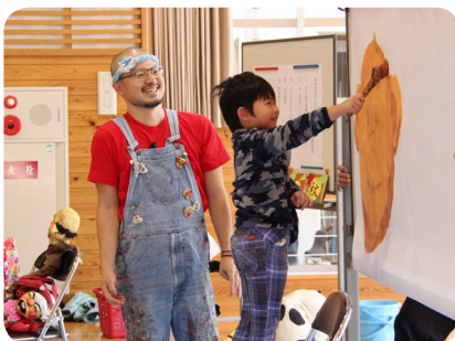
▲ライブペイントの様子