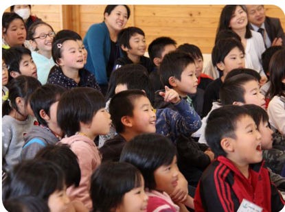
▲ライブペイントで盛り上がる子どもたち