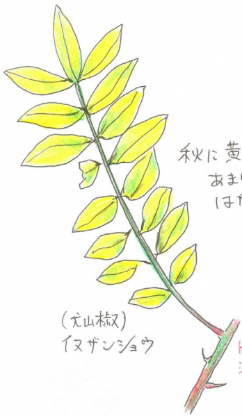
秋に黄葉するが あまりきれいで はない。