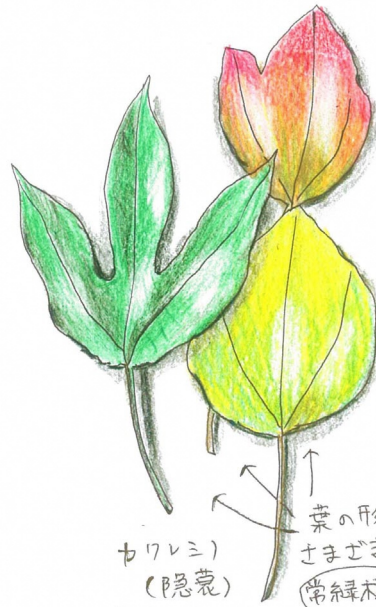
カクレミ (隠葉) 葉の形は さまざま 常緑樹