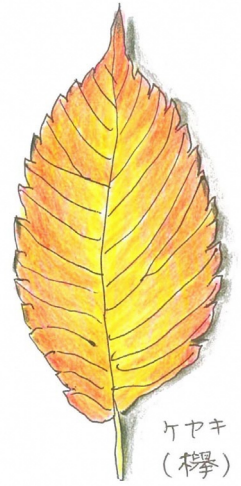
ヤマキ (樺) 秋紅葉する