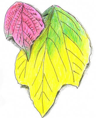
アカメガシワ(赤芽柏) 落葉樹