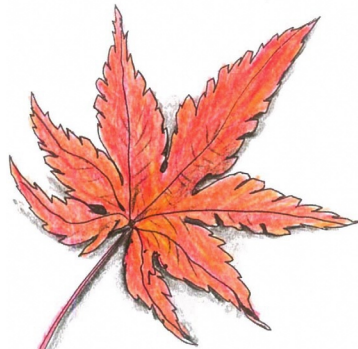
イロハモミジ(いろは紅葉) 落葉樹