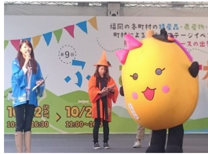
▲東峰村PRタイム (ふくおか町村フェアにて)