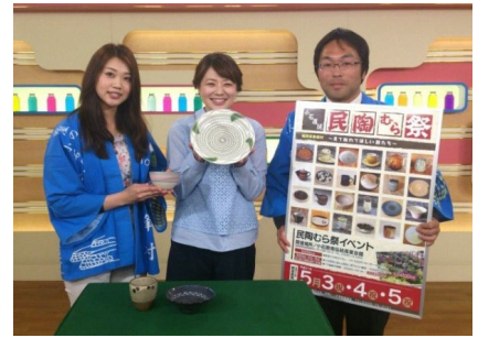
▲民陶むら祭PRタイム (NHKにて)