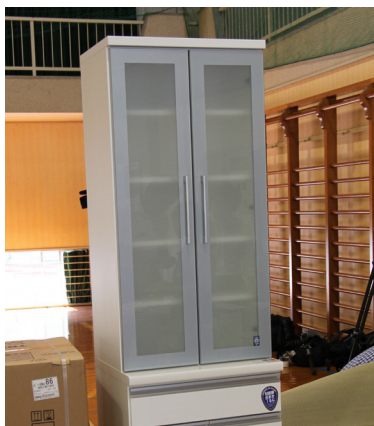
▲大川家具さんより家具の提供