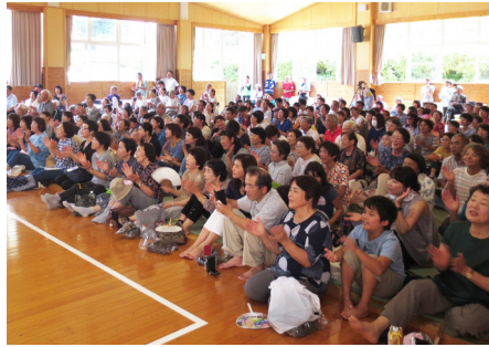
▲盛り上がる会場内