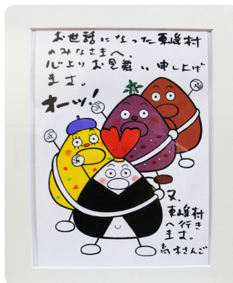
▲高木さんごさん作