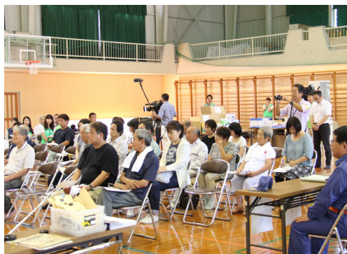
▲入居についての説明を受ける様子