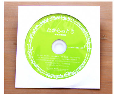
▲皆さんにプレゼント