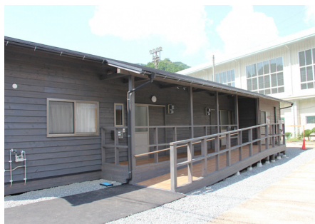
▲旧宝珠山小運動場にできた仮設住宅

住宅には企業等の寄付で、家具や日用品の提供があり、これからの生活再建に大きな助けとなりました。