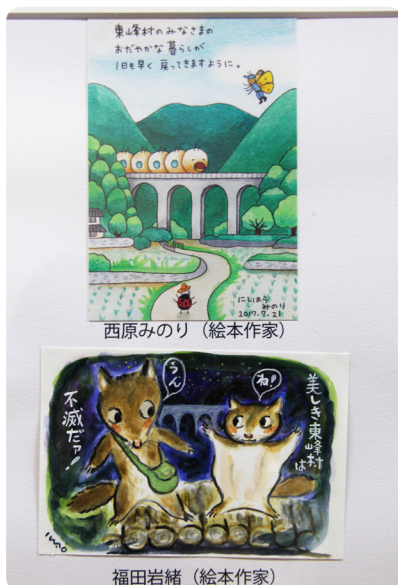
◀上：西原みのりさん作 下：福田岩緒さん作