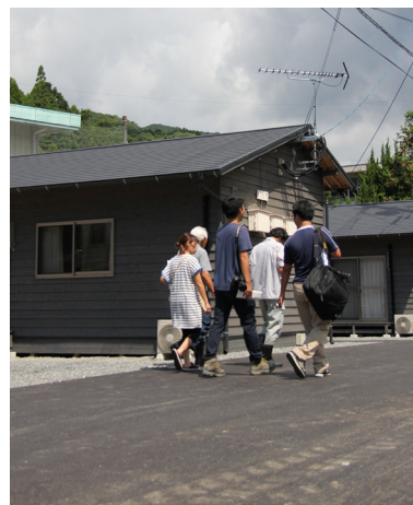
▲仮設住宅に向かう住民