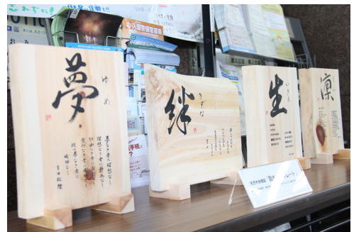
▲檜で作った励ましプレート