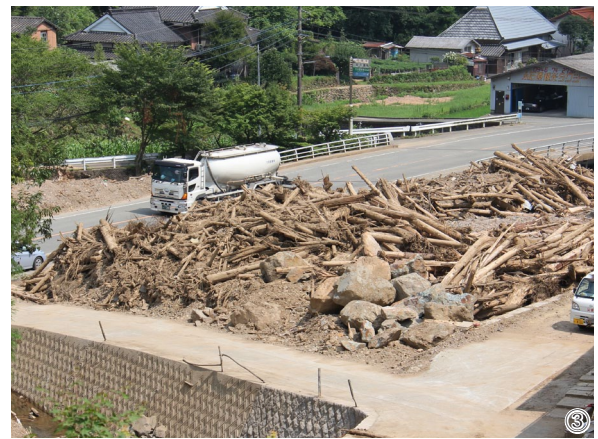
①山が崩れ木々もなぎ倒された塔の元付近②土砂が道を被り通行止になった釜床の村道③大量の流木と岩が積み上げられた鶴地区の一角