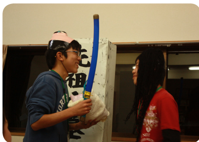
▲村の民話をもとに小演劇を披露