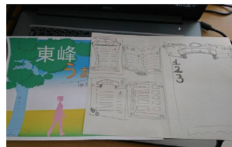
▲ウォーキングマイレージランキング作成