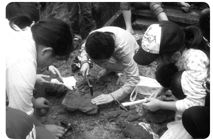
▲石を割り、化石を探す様子