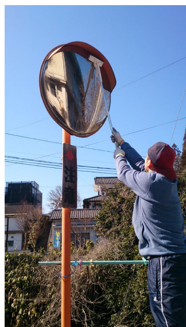
▲カーブミラー掃除