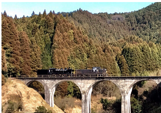
▲めぐね橋を通過する SL 人吉

今回の回送記念品として SL や石炭をイメージして作られた黒色のまんじゅうが配布されました。