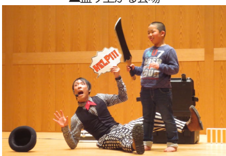
▲村の子どもたちと一緒に▲