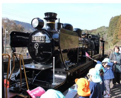
▲園児によるお出迎え