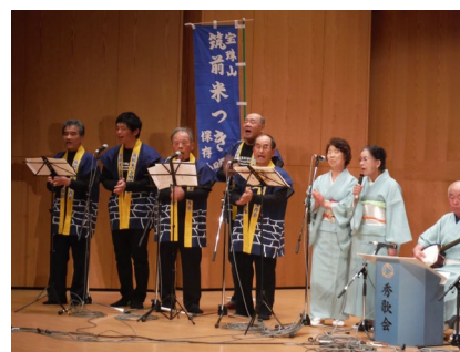
▲筑前米つき唄の披露

3月19日（日）、いづみ館多目的ホールにおいて行われました。当日は、フラダンス（特別出演）や太鼓、神楽等を行う協会所属の各団体が日頃の練習の成果を発表しました。また、同館別室では、東峰学園中学部や木工塾等による作品の展示や茶道教室による来場者へのお呈茶も行われました。