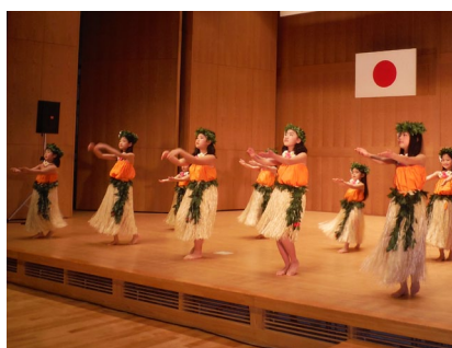
▲フラダンスの発表