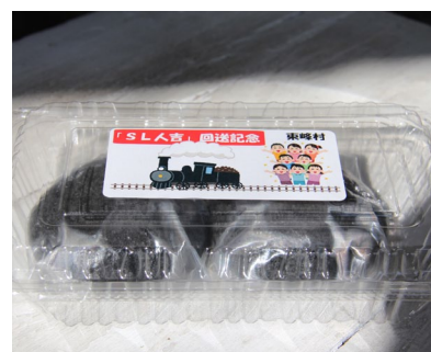
▲回送記念の黒いまんじゅう（中は白あん）