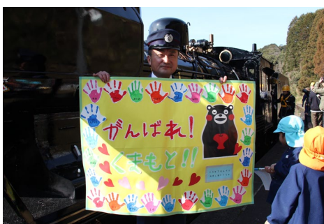
▲手渡された寄せ書き「がんばれ！くまもと!!」