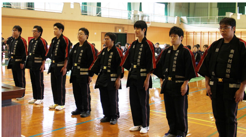
▲新入団員のみなさん