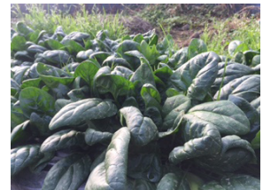
▲栽培したちぢみホウレンソウ