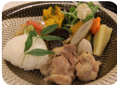
▲第2回の食事会 イタリアン創作ランチプレート