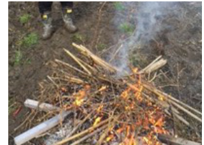
▲コショウ焼却処分の様子

時期遅れで播いた「ちぢみホウレンソウ」や「春菊」も無事育ち出荷することができました。野菜の少ない時期に出荷でき売れ行きも良く、ハウスを利用して時期をずらすという手法を試す良いきっかけとなっています。