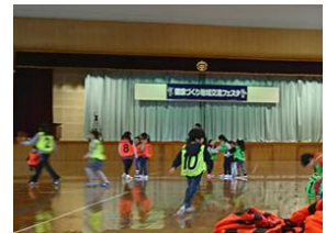
▲健康づくり地域交流フェスタ