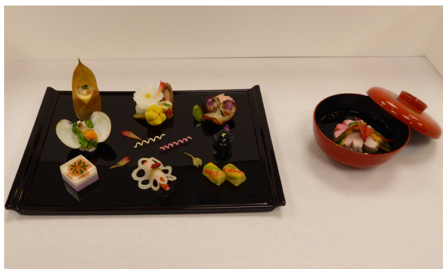
▲受賞作品: テーマ「春爛漫」前菜作品と碗(吸い物)作品