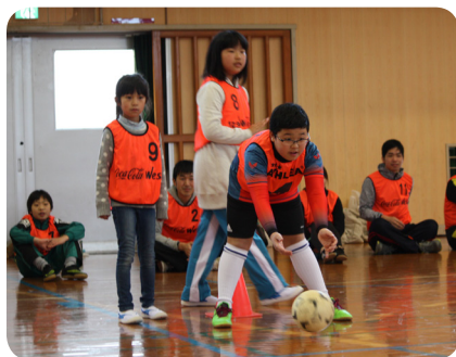
▲チームで転がしゴルフ

今後も、このようなイベントを実施して、健康づくりと地域交流の輪を広げていきたいと思えます。今回参加できなかった方も、ぜひ、来年度の各種スポーツ大会や「らぶすぽ東峰」のニュースポーツ教室などに、積極的に参加していただき、スポーツを通して、お子様から高齢者の方まで、世代や地域の垣根を越えて交流を深め、健康で活力ある元気な東峰村をつくっていきましょう！！