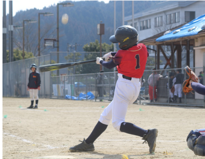
▲バットを勢よく振って