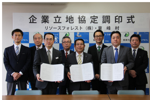
▲調印後の記念撮影

1月19日(木)、東峰村とリソースフォレスト(株)(本社:東峰村)との間に立地協定が結ばれました。リソースフォレストは、間伐材や木廃材を主原料とする木質チップを固形化した舗装材の製造を行う会社で、村所有の倉庫を活用して工場を新設します。工場の新設に伴い、本社を新工場敷地内に移転し、5月に操業開始が予定されています。