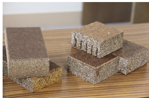
▲木質舗装材のサンプル