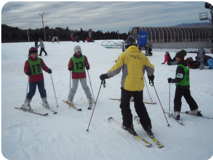
▲滑り方の指導を受けます

東峰 Jr. みらい塾は2月4日(土) 児童21名、大人13名で九重森林公園スキー場へ行きました。午前中2時間はインストラクターの方から安全に滑られるよう指導して頂き、昼食の後は数名のグループで楽しく滑る事が出来ました。数人は、上級者コースへもチャレンジ出来たようです。