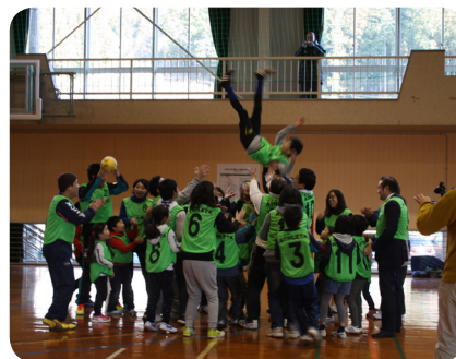
▲手つなぎナンバーコール