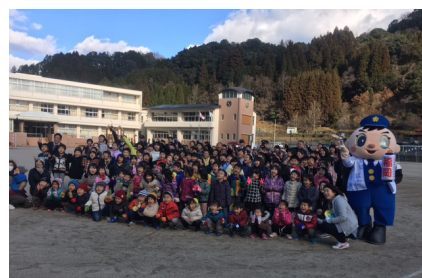
▲最後にみんなで記念撮影をしました