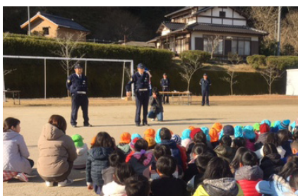
▲110番システムについて説明