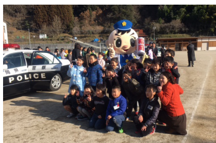
▲マスコットキャラクター「ふっけい君」との撮影