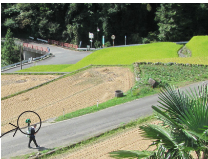
トレッカー ▲日本の棚田百選「竹の棚田」

平成 28 年 12 月、東峰村内 20 エリアのストリートビューが公開されました。