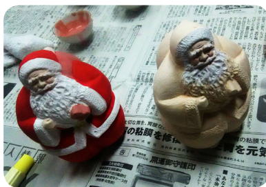
▲絵付けしたサンタクロース