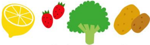
レモン・イチゴ・ブロッコリー・じゃがいも

ウイルスや細菌からカラダを守るための免疫力を高める働きを持つビタミン。ビタミンCはカラダに溜めることができないので、毎日の食事に継続的に取り入れるようにしましょう♪