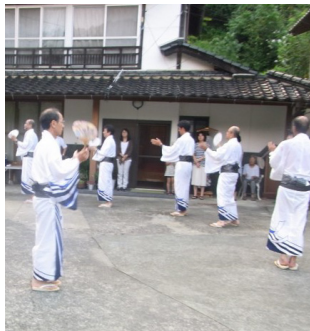
▲今回揃えた浴衣での初盆踊り