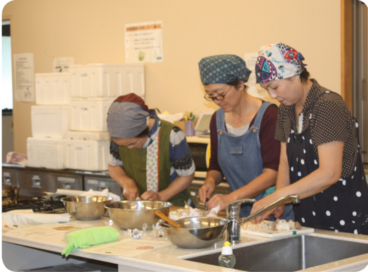
▲いずみ館調理室にて

9月30日(金)いずみ館調理室に於いて、アレルギー対策で米粉を使ったパンとスープを作りました。パンは、3つのパターン(①材料をパウンド型に入れオーブンで焼く ②材料を炊飯器に入れて炊く ③ホットプレートでホットケーキの要領で焼く)スープはキノコを4種類みじん切りにして豆乳と米粉でとろみをつけました。②のパンが出来上がった時美味しい焼きあがりに塾生から歓声が上がりました。最後