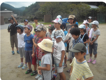
▲大勢の子どもたちが集まりました