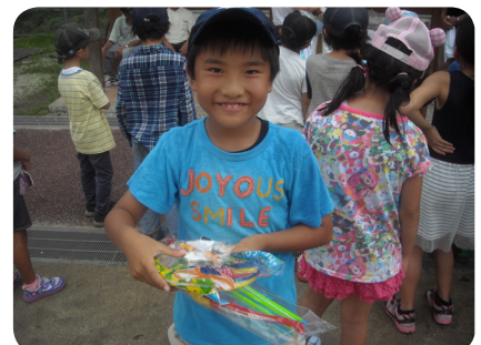
▲景品をもらいました