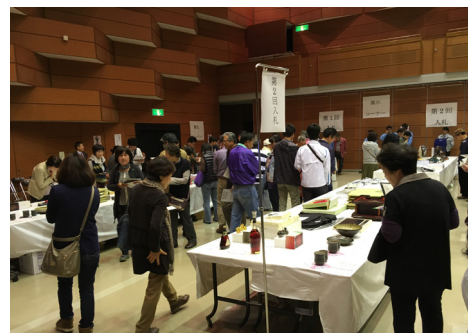
▲県・市町村合同公売会の様子

※（各自治体の）ホームページに、県・市町村の出品物の詳しい内容を掲載しています。