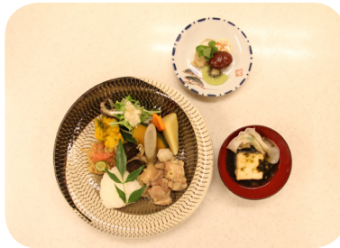
▲第2回の食事会 イタリアン創作ランチプレート