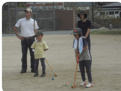
▲ボールの行方を見守っています