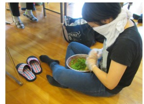
▲ゆずこしょう擦り

それから、ハウスを利用してちぢみホウレンソウ他、数種の種を蒔きました。時期的に少し遅れているので育つかどうか不安ですが、実験しながら育てたいと思います!