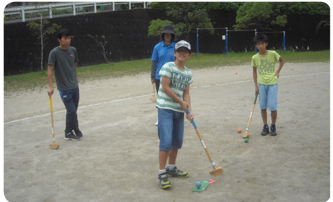
▲狙いを定めて打ちます