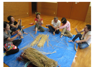
▲クラフト体験の様子