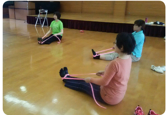
▲ベルターを使用した体操