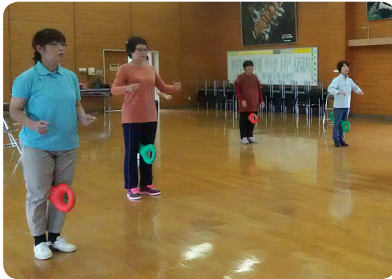
▲ベルを使用した体操

次回の女子みらい塾は11月16日・24日に絵手紙講座(年賀状作り)を計画しています。