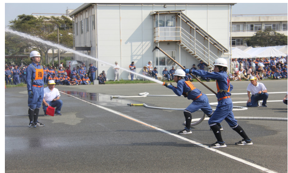
▲見事なチームワークです