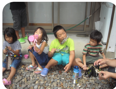
▲美味しくいただきました