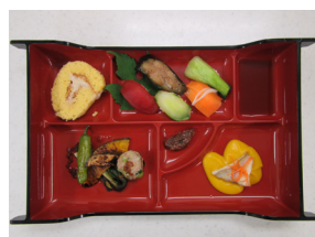
▲寄付していただいた野菜で作った料理