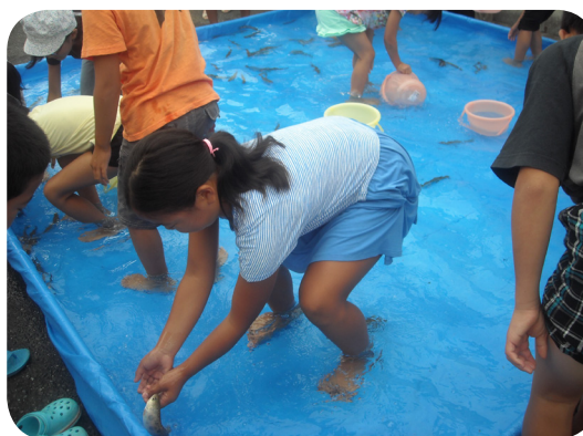
▲ヤマメのつかみ捕り

9月3日(土)東峰 Jr. みらい塾は児童(幼児含む)30名、大人15名の参加でヤマメのつかみ捕りとアウトドアクッキングを行いました。