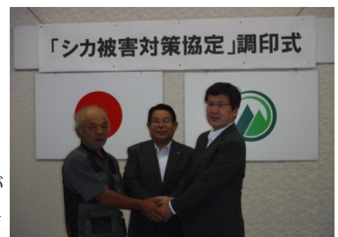
▲熱い握手を交わしました

(1) 目的：東峰村内の国有林及び周辺のシカ被害対策推進のために、協力体制を構築し、農林業被害及び生態系被害の防止を図る。(2) 対象区域：東峰村内の国有林、隣接する民有林及び農地 (3) 協定締結により期待される効果：①協力体制の構築が図られ、シカ被害の防止・軽減が促進される。②東峰村猟友会へのくくりわな(30器)の貸与により、シカ捕獲が促進される。