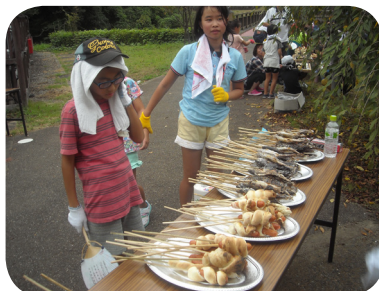
▲パンも一緒に焼きました