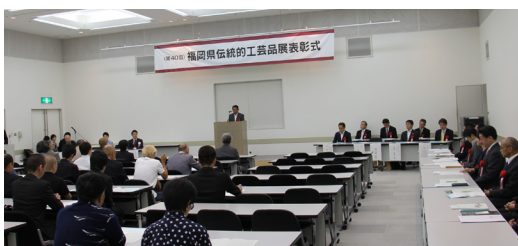
▲伝統的工芸品展表彰式の様子