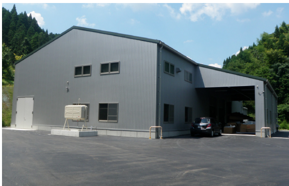
▲ライスセンター外観

よる有色異物の除去）、(2)農作業の効率化（乾燥・調整作業の省力化）、(3)施設の共同化によるコスト削減と持続的な米作り（乾燥機所有農家の維持費削減、営農組合等による受託作業の拡大）を目的とします。