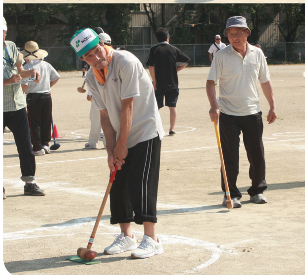
▲真剣に狙いを定めます