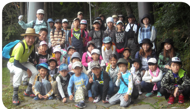
▲みんなで集合写真をパチリ