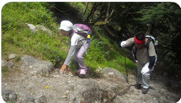
▲険しい道を一生懸命登ります

今回は低学年の参加が多くて心配しましたが、保護者の方の応援もあり楽しい登山となりました。ご参加頂きありがとうございました。