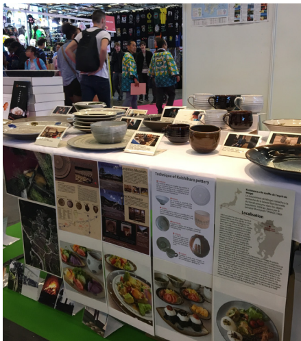
▲東峰村展示ブース

こうして4日間、フランスの‘オタク’もとい日本ファンの皆様にも伝わり、展示販売した特産品、陶器共にめでたく完売に至る。