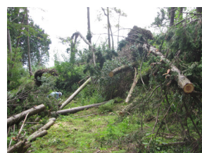
▲整備されていない山道