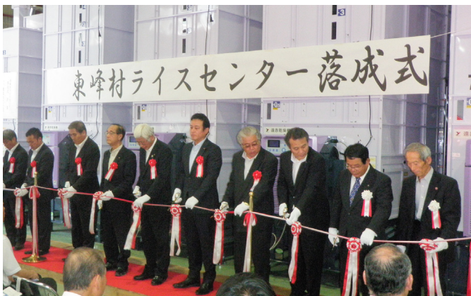
▲テープカットの様子