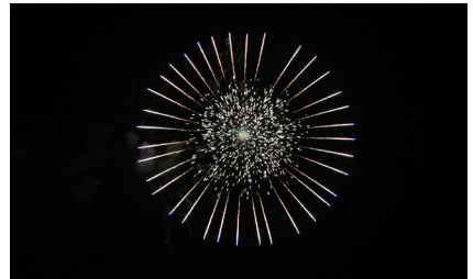
▲きれいな花火が打ち上がりました