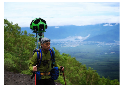
▲機材を背負って撮影をします

「トレッカーパートナープログラム」とは、グーグル（Google）が提供している Google マップおよび Google Earth の地図上の任意の地点の360度パノラマ画像を閲覧しながら、あたかもその場所を散策しているような疑似体験が楽しめるストリートビューの撮影方法の一つで、背負い式のストリートビュー撮影機材「トレッカー」を無償で貸出すプログラムです。今回、このプログラムを通じて、村内の眺望の素晴らしい登山道や観光スポット、日本の原風景が残る集落の小道など車では行けない、又は地元の人しか知らないけど是非見てもらいたい場所を「トレッカー」で撮影します。