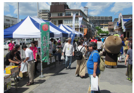
▲日田駅での観光PRイベント

今回東峰村のPRとして車内アナウンスで東峰村の魅力を伝えました。大行司駅には美星保育所の園児がホームで列車に手を振りお出迎えをしました。子どもたちの列車を見つめるキラキラとした目はとても可愛らしく微笑ましくありました。また、日田駅では駅前にて日田市、添田町、東峰村による特産品の販売や熊本市観光PRイベントもあり大変盛り上がりました。