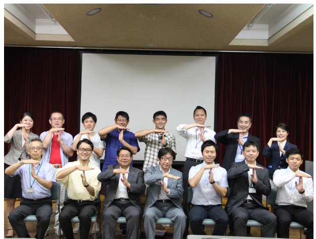
▲集合写真のポーズはプロジェクト T の「T」