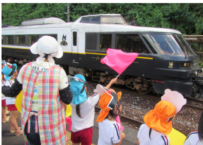
▲列車に元気よく手を振る園児たち

8月31日（水）に「熊本復興支援。日田彦山線の沿線の方々による応援」ということで門司港駅発、日田駅着で折り返し、門司港駅まで戻るというルートでやってきました。特急「あそぼーい！」は熊本駅～宮地駅間で運行されていた観光列車「あそBOY」「あそ1962」の後継列車として運行を開始した列車です。車両両端は全面展望のパノラマシートで景観を満喫できます。