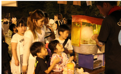
▲わたあめを待つ子どもたち