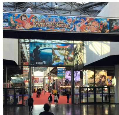
▲ジャパン・エキスポ会場