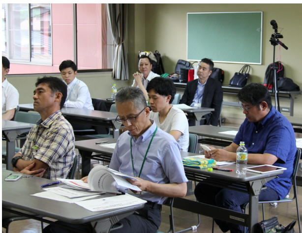
▲春期講座最終報告会の様子

今期の最終報告において陶器・観光ともに、取り組み内容に一定の方向性が打ち出されたため、来期開催予定の秋期講座では具体的な実施計画の策定に取り組む予定です。