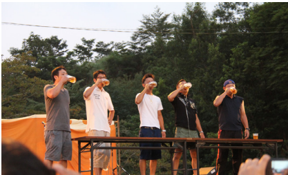
▲ビールの早飲み大会

今年で39回目となった小石原夏祭り。地元の方をはじめお盆の帰省とも重なり、たくさんのおもたちと家族が参加され賑わいました。ビールの早飲み大会、バンド演奏、毎年恒例の夏祭り抽選会と大変盛り上がりました。最後には雲一つない夜の空にきれいな花火が打ち上がり歓声が沸きました。子どもたちの浴衣姿に無邪気な笑顔、家族の楽しい会話など思い出になった夏祭りでした。