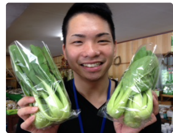
地域おこし協力隊 清水

無料で出荷代行します！ 野菜の量は問いません！ 穫れた時に穫れた分だけ 1 つでも OK ♪