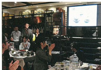
▲産地の PR や消費者との意見交換などを行いました。

福岡県の「戦略的首都圏マーケティング事業（福岡県産品の首都圏進出を目指した開発支援販路開拓事業）の一環として窯元 4 名が参加し、東京ミッドタウンでの研修・マーケティングイベントに参加しました。