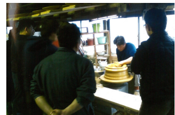
▲陶器組合青年部に視察の話やろくろ実演を行いました。