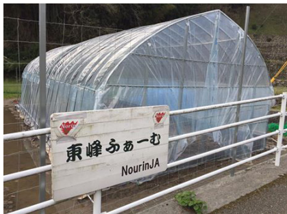
▲東峰ふぁーむにハウスを建てました

岩屋祭りに、筑前米つき唄保存会、天狗のゲタ飛ばしの選手として出演しました。自分が舞台に立つとは思っていなかったのでも嬉しかったです。