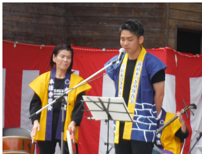
▲筑前米つき保存会で唄を披露