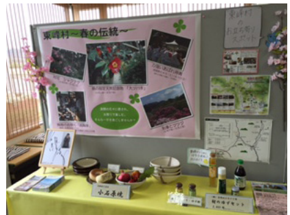
▲福岡銀行展示ブース