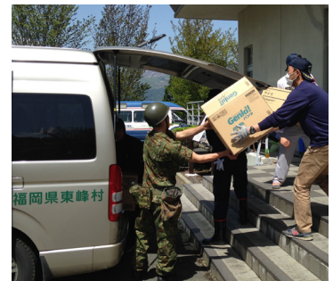
▲ 救援物資引渡しの様子