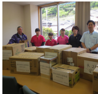
▲ 宝珠の郷から頂いた物資