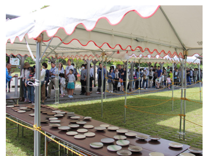
▲ 小皿販売にできた長蛇の列

5月3日（火・祝）～5（木・祝）まで、春の民陶むら祭が開催されました。初日の天気は雨でしたが、二日目からは天気も回復し、多くの小石原焼のファンで賑わいを見せていました。小石原焼伝統産業会館では、フリーカップの絵付体験や小石原焼の小皿付きおにぎりの販売が行われました。