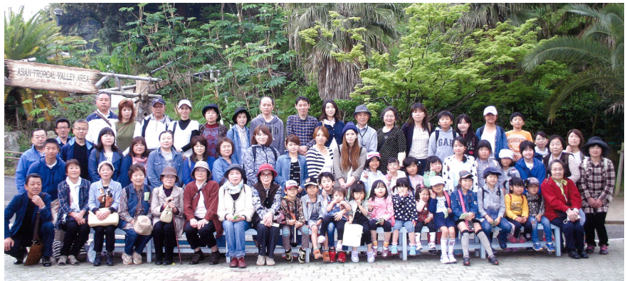
▲集合写真(福岡市動植物園にて)

お昼からは、「JA糸島産直市場伊都彩菜」に行き、農畜産物や海産物、加工品等がずらりと並んだ店内を回り、お買い物を楽しむことができました。次回の開催時も、多数の方のご参加をお待ちしております。