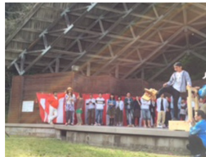
▲ゲタ飛ばしの様子