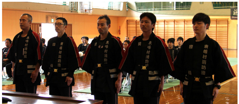
▲新入団員のみなさん