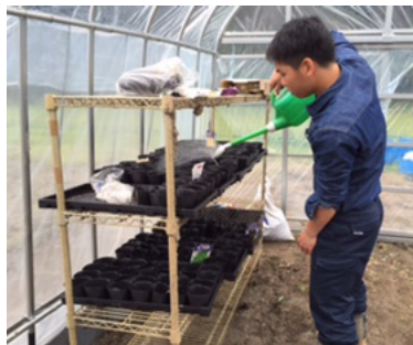
▲ハウスの中で育苗中